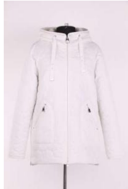
• 37203Q • 37205Q • 406340Y15CB